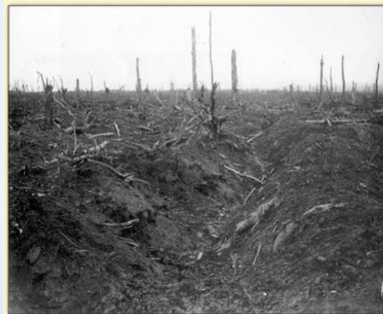
Les restes d'une forêt