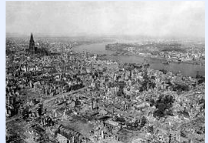
Une ville rasée