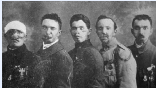
Des mutilés de guerre

Le bilan de cette guerre est terrifiant : près de 10 millions de soldats tués dont environ 1 400 000 soldats français ! On compte, rien que pour la France, 4 millions de blessés ou mutilés. Des villes entières sont détruites.