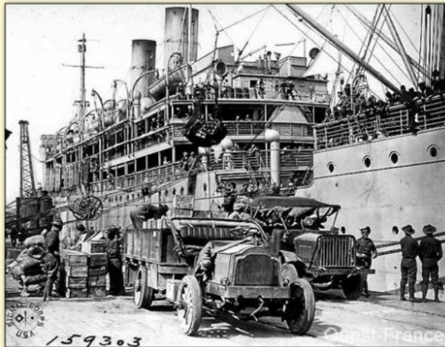
Les américains débarquent en Europe

Le 6 avril 1917 , le président américain Wilson entraîne les États-Unis dans la guerre aux côtés de la France.